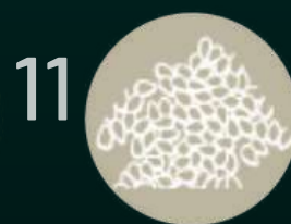
Сусамено семе и продукти от него