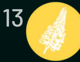
Лупина и продукти от нея