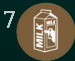
Мляко и млечни продукти