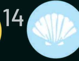
Мекотели и продукти от тях

ВСИЧКИ ХРАНИ И НАПИТКИ В МЕНЮТО ОТБЕЛЯЗАНИ С * СЪДЪРЖАТ АЛЕРГЕНИ