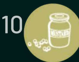
Синап и синапено семе (горчица)